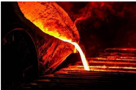
Industria Siderúrgica, Química