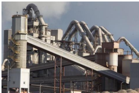
Industria Cerámica y Cementera