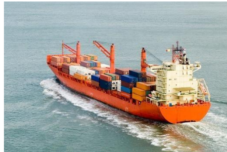
Industria Pesquera y Naval