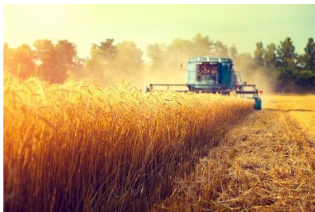
Industria Molinera y Agroalimentaria