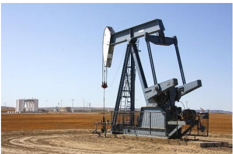
Industria Petrolera y Gas