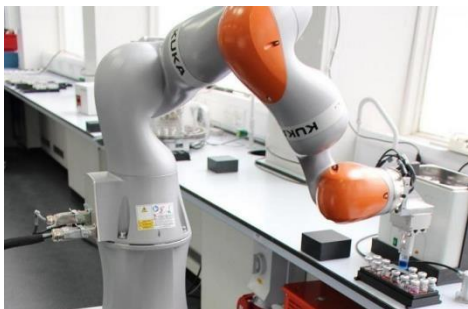
Industria Química y Farmacéutica