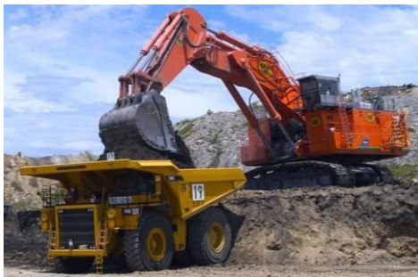
Ingeniería, Construcción y Minería