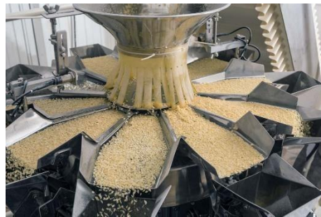
Industria Alimentaria, Azucarera